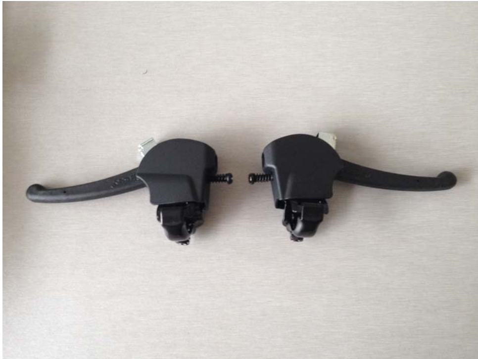
自行车闸把: N120SPC-1 3/4 自転車用ブレーキ: N120SPC-1 3/4